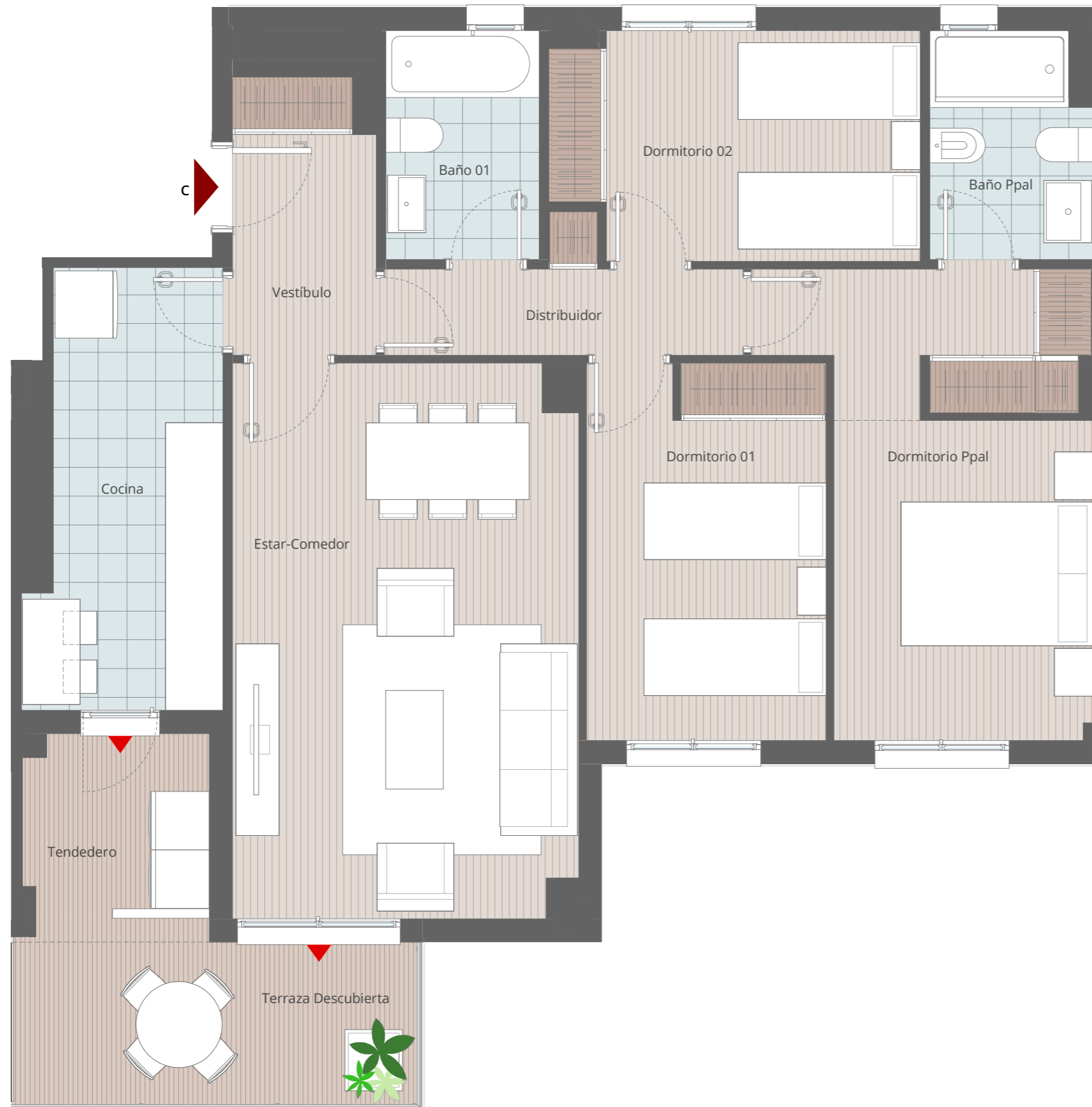
CUADRO SUPERFICIES VIVIENDA TIPO V3D.22